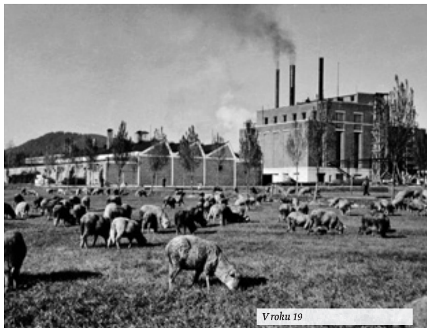
V roku 19